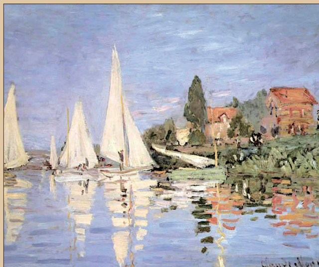
V galerii Miethke byly ve 20. letech minulého století k vidění i obrazy Clauda Moneta.