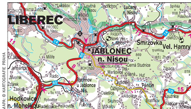
MAPA: © KARTOGRAFIE PRAHA

Začneme trochu ze široka. Nebude snad k dnešním obyvatelům města Jablonce neuctivé, když napíšeme, že jejich město bylo ještě v osmnáctém a na počátku devatenáctého století nevýznamné sídlo. Pravda, první zmínka o Jablonci je sice už z roku 1356, ovšem ke stálému osídlení místa dochází až ve století šestnáctém. Zásadní změna pak nastala až ve druhé polovině věku následujícího. Začíná se totiž dít zdejšími sklárům a obchodníkům se sklem. A na