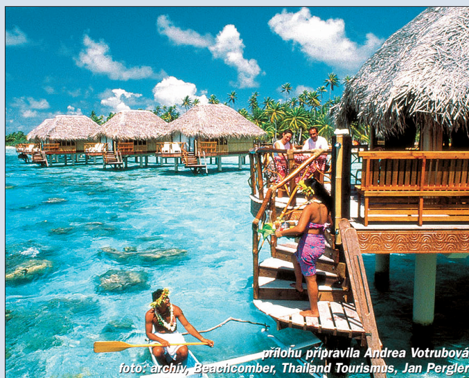
přílohu připravila Andrea Votrubová

Za pokus stojí i zdolání místních vrcholů Mt. Pahia a Mt. Otemanu, odkud si lze vychutnat úžasný pohled na oceán. Azurový obzor a krásu rajské přírody si mnozí dopřejí poznat i během vyhlídkového letu helikoptérou kolem ostrova (15minutový let za cca 120 USD, 30minutový za cca 190 USD).