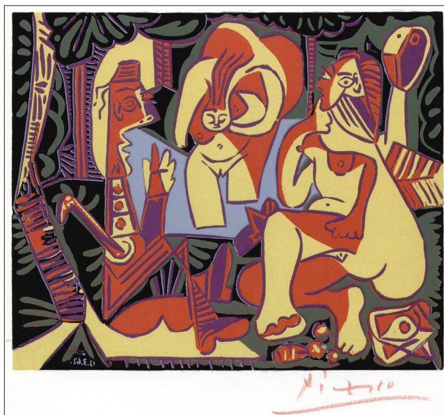
Pablo Picasso: Snídaně v trávě podle Maneta