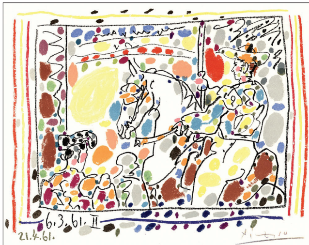
Pablo Picasso: Pikador II

Výstava Pablo Picasso: Lidská komedie, Galerie Art, Chrudim, Resslovo nám. 135. Do 27. listopadu. Otevřeno: pondělí – pátek 10 – 12.30 a 14 – 17 hod., sobota 9 – 11.30 hod.