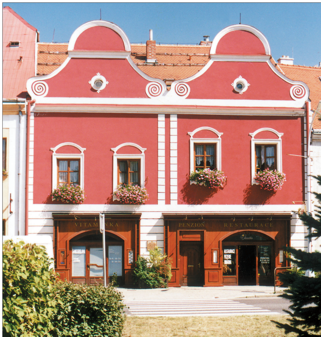
Nejstarší dochovaný dům na náměstí.