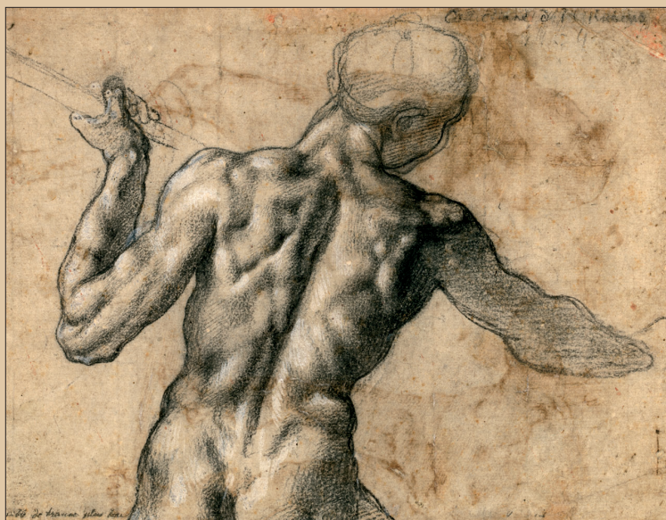
Akt mužských zad, okolo roku 1504, křída.

Návštěvníci zhlédnou ale i kresby manýristů, mezi nimi Domenica Beccafumiho, Franceska Salvatiho a Giorgia Vasariho, a také hlavní dílo Daniela da Volterra, pro něž autor dostal několik různých návrhů od Michelangela.