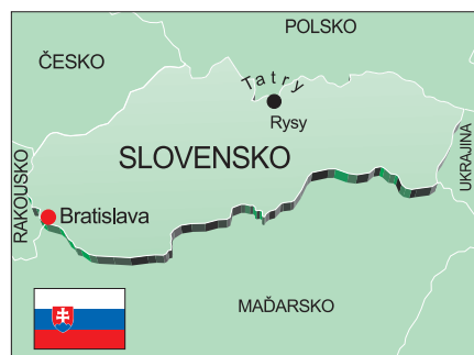
Mapa: © Kartografie Praha

Na Rysy (2503 metry nad mořem) se dá vyrazit ze dvou míst – buď ze stanice elektrického vláčku Popradské pleso, anebo ze Štrbského Plesa. Vlaková stanice i přilehlá obec nese stejné jméno jako známé jezero. Časově je to víceméně jedno a obě trasy se stejně po několika kilometrech slíjí v jedinou. A pokud zvolíte druhou variantu, alespoň si můžete prohlédnout Štrbské pleso. Značená stezka vede po břehu. Horské jezero dosahuje hloubky až dvaceti