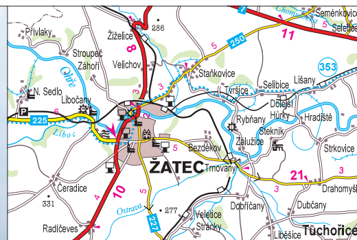
Mapa: © Kartografie Praha