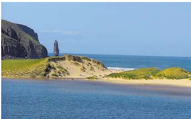
Sandwood Bay označovaná jako nejkrásnější pláž severní Evropy.

Jde o oblast, která je zatím ještě prakticky nedotčená turismem, ačkoli zejména zdejší pláže patří k opravdovým prázdninovým klenotům. Vybírat si můžete z větších písečných pláží, ale i z naprosto izolovaných místek,