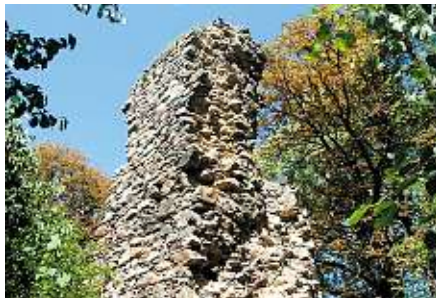
Zřícenina gotického hrádku Rabštejnek

Dvoulůžkové pokoje za 600 korun nabízí v Chrudimi také hotel Alfa na ulici Čs. partyzánů. Telefon: 469 620 238.