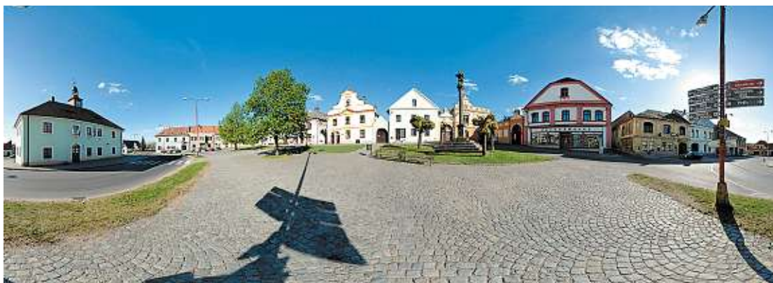
Ve Staročeské hospodě na náměstí v Luži mívají řádně naložené utopenice.

Kolem nejpůvabnějšího úseku z Vrbatova Kostelce až k Horeckému rybníku vede podél potoka modrá turistická značka. Označuje trasu, z níž lze pozorovat vodní kaskády i skalní žebra omývaná proudem vody. Před Chrástí se modrá značka od potoka odpojuje a vede na náměstí. Kdo si chce po vodním dobrodružství uklidnit nervy sladkostmi a zároveň třeba odměnit děti za turistický výkon, →