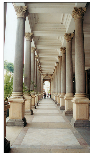
Mlýnská kolonáda od architekta Josefa Zítka

Cesta podél Teplé vás dovede až k Puppě, kolem honosných domů z přelomu 19. a 20. století. Spatříte divadlo, které bylo před něko-