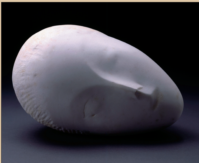
Brancusiho mramor Spící Múza I z let 1909 až 1910