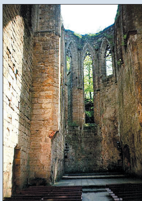
Torzo klášterní katedrály nad Oybinem

doby s četnými rokokovými prvky. Stavitel F. Höger vytvořil dvoupatrovou obdélnou budovu se dvěma postranními nízkými polygonálními věžemi se zvonovými střechami. Průčelí nad hlavním vchodem završuje trojúhelníkový štít, ozdobený pro rokoku typickými vázami, nad mansardovou střechou vyčnívá věžička. Další majitelé ale nechali zámek zchátrat a nějaký čas byl dokonce používán jako sýpka, což znehodnotilo freskovou i štukovou výzdobu sálů. Roku 1901 dal nový majitel pseudobarokně upravit do dnešního stavu. V přízemní jídelně je dochována nástropní malba bo-