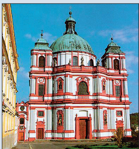
Chrámsv. Vavřince v Jablonném v Podještědí

Poloha Grabštejna se hodí k výletům do celého kraje. Kromě necelých dvacet kilometrů vzdáleného Liberce leží zhruba stejně daleko i zámek Lemberk . Při cestě po silnici z Liberce do Jablonného v Podještědí je vidět již zdálky. Manželku zakladatele původního gotického hradu z 13. století Zdislavu z Lemberka prohlásila katolická církev koncem minulého století za svatou pro její milosrdenství v kruté době. Prvního června, kdy na Grabštejně vystupují Pernštejní, pořádá Lemberk v rámci Dne dětí Putování pohádkou, při němž výletníci narazí na pohádkové bytosti, uvidí šerm, uslyší hudbu a budou i při zahájení výstavy Pohádkový zámek. Jen několik kilometrů od Lemberka stojí v Jablonném v Podještědí monumentální barokní chrám. Na západním okraji města je také rozlehlý park, v jehož středu stojí zámek Nový Falkenburg. Na místě původní tvrze jej nechal v letech 1562 – 72 postavit Jindřich Berka z Dubé. Po několikaleté změně majitele koupil zámek i s panstvím roku 1718 Jan Pacht z Rájova, jehož dědicové přestavěli o několik desítek později původně renesanční budovu do pozdně barokní po-