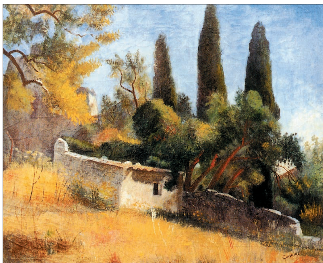
Otakar Kubín: Krajina v Provence