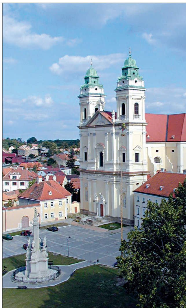
Kostel Nanebevzetí Panny Marie – dominantní budova celého náměstí a morový sloup z roku 1680

sklepů, kostelem z roku 1658 a barokním hřbitovem z 1. pol. 18. stol. Pavlov z výšky ochraňuje romantická zřícenina hradu Děvičky, jinak zvaného Dívčí hrádek, který dříve sloužil jako strážný hrad pro ohlašování bouřkových mraků, požárů a jiného nebezpečí. Druhý týden v srpnu můžete v obci zažít tradiční krojované hody. Aktuální informace: www.mesta.obce.cz/pavlov