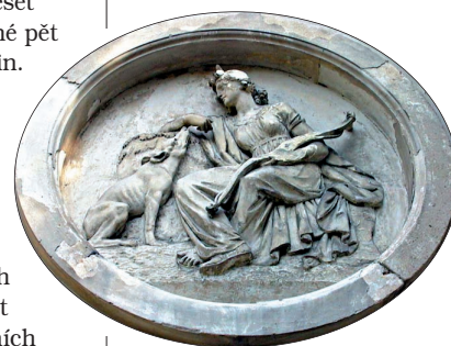
Výzdobu tvoří reliéfy znázorňující dramatické scény z lovu

s bohyní Měsíce. Lovecké výjevy jsou také na jižní vstupní straně, na severní straně jsou v reliéfech motivy antických bájí (koupající se nymfy, které pozoruje Kupidos). Rendezvous můžete