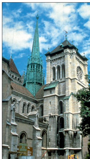
Katedrála St. Pierre

Jogging a in-line brusle tu patří společně s jízdou na kole jako ve většině větších měst k nejoblíbenějším činnostem. V letních měsících skýtá mnoho pro většinu měst ve vnitrozemí nezvyklých příležitostí k odreagování jezero. Plachtění, jízda na vodních lyžích, ale i plavání přímo v přístavu. Geneve plage – pláž u jezera s vlastním bazénem, nabízí hřiště pro volejbal, basketbal, petanque apod.