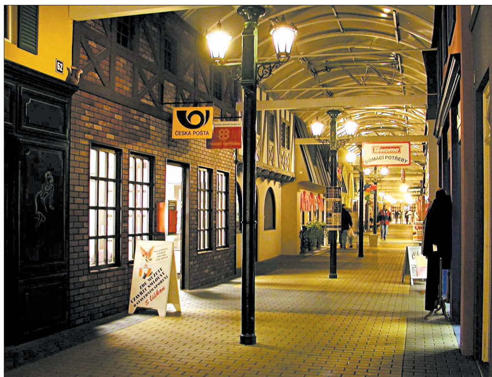
Snímek Centrum Babylon

– největší krytý zábavní komplex v České republice