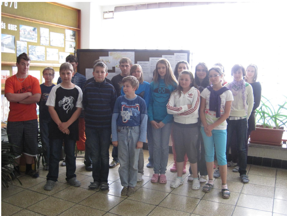
Nástěnka na chodbě