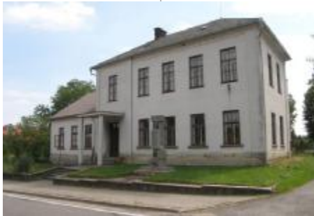
Ve Vlčkově se v bývalé jednotřídce mimo jiné chystají zrekonstruovat unikátní historickou školní učebnu.

Více v zářijovém vydání Moderní obec (Venkovské školičky, nebo brownfieldy?).