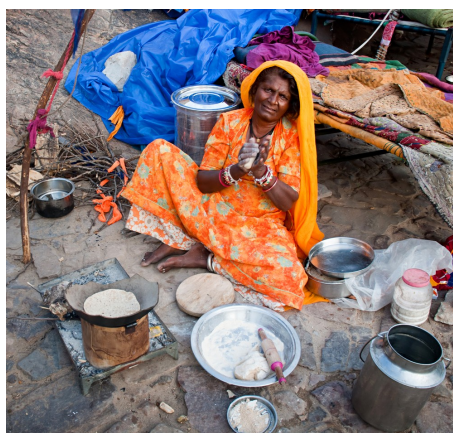
Ilustrační foto: Životní podmínky v Indii

Manažeři se na těchto misích dostávají mimo svoji komfortní zónu a často zažívají doslova kulturní šok. Dostávají se z civilizované, zajištěné země do míst, kde nemusí být elektřina a obyvatelé řeší naprosto odlišné problémy. Jsou vystaveni otázkám a situacím, se kterými se dnešní společnost běžně nesetká. Díky tomu v sobě dokážou objevit vlastnosti, o kterých dříve netušili, že je mají. Příkladem takové úspěšné mise může být cesta manažerky, která byla v práci důležitým kreativním členem týmu, ale chybělo jí sebevědomí k prosazení. Po návratu z Indie, kde dokázala rozšířit výměnný obchod surovin z vesnice do měst o nezbytné zdravotní a hygienické potřeby, se stala sebevědomým člověkem a její úspěšnost v prosazení vlastních nápadů rapidně stoupla. Z osobní zkušenosti by toto „prospěšné dobrodružství“ doporučila všem, kdo se chtějí rozvíjet, mají touhu něco změnit a díky svým zkušenostem to i dokázat. Osobní proměna s tím přijde sama. (tz)