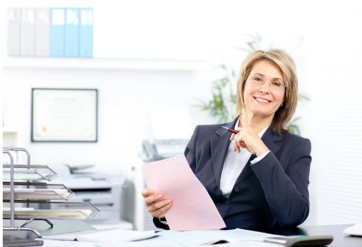
Ilustrační foto: Ženy ve vedení

Podobný trend lze sledovat i ve financích a marketingu. Finanční ředitelku má aktuálně 44 % největších českých firem, ve srovnání s 28 % v roce 2009. Obdobně v roce 2009 byla čtvrtina marketingových oddělení největších českých firem vedena ženou, nicméně o šest let později má v čele marketingu ženu 41 % firem. V posledním roce, mezi lety 2013 a 2014, ženy pozvolna začaly vytlačovat muže i z křesel obchodních ředitelů. Podíl žen na místě šéfa obchodu meziročně vzrostl o více než 3 procentní body z 14 % v roce 2013 na 17 % v roce 2014. (tz)