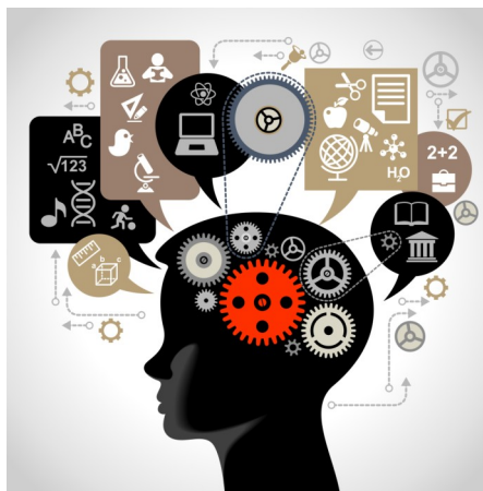
Ilustrační foto: Veletrh vzdělávání

Dům zahraniční spolupráce (DZS), jako již tradičně, pro české vysoké školy organizuje společný stánek pod značkou Study in the Czech Republic. Jelikož se jedná o mimořádnou příležitost k navázání strategických partnerství se zahraničními univerzitami, seznámení se s novými trendy v mezinárodním vysokoškolském vzdělávání a vyměňování si zkušeností s kolegy z celého světa, český stánek se letos představí v nové atraktivnější podobě. Na stánku Study in the Czech Republic se představí následující univerzity: České vysoké učení technické v Praze, Česká zemědělská univerzita v Praze, Jihočeská univerzita v Českých Budějovicích, Masarykova univerzita, Slezská univerzita v Opavě, Technická univerzita v Liberci, Univerzita Palackého v Olomouci, Univerzita Pardubice, Univerzita Tomáše Bati ve Zlíně, Vysoká škola báňská – Technická univerzita Ostrava, Vysoká škola ekonomická v Praze, Vysoká škola chemicko-technologická v Praze, Vysoká škola technická a ekonomická v Českých Budějovicích, Vysoké učení technické v Brně a Západočeská univerzita v Plzni. Zástupci výše uvedených univerzit společně s reprezentanty DZS budou zájemcům z řad odborné veřejnosti poskytovat informace o možnostech studia v České republice a mezinárodní spolupráci v oblasti vzdělávání.